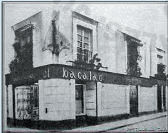
Pepe Ceballos Ceballos Colegiado 8358 Socio C.N.F.-148